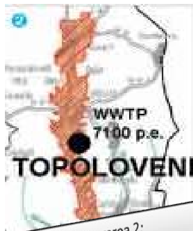
Aglomerarea 2: Topoloveni