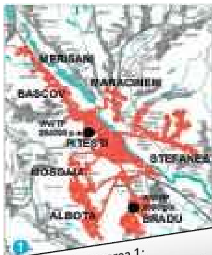
Aglomerarea 1: Pitești, Ștefănești, Bascov, Mărăcineni, Merișani, Bradu, Albota, Moșoaia